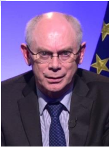
Herman Van Rompuy

De ALS Liga werkt samen met enkele bekende Vlamingen die de organisatie een hart onder de riem steken.