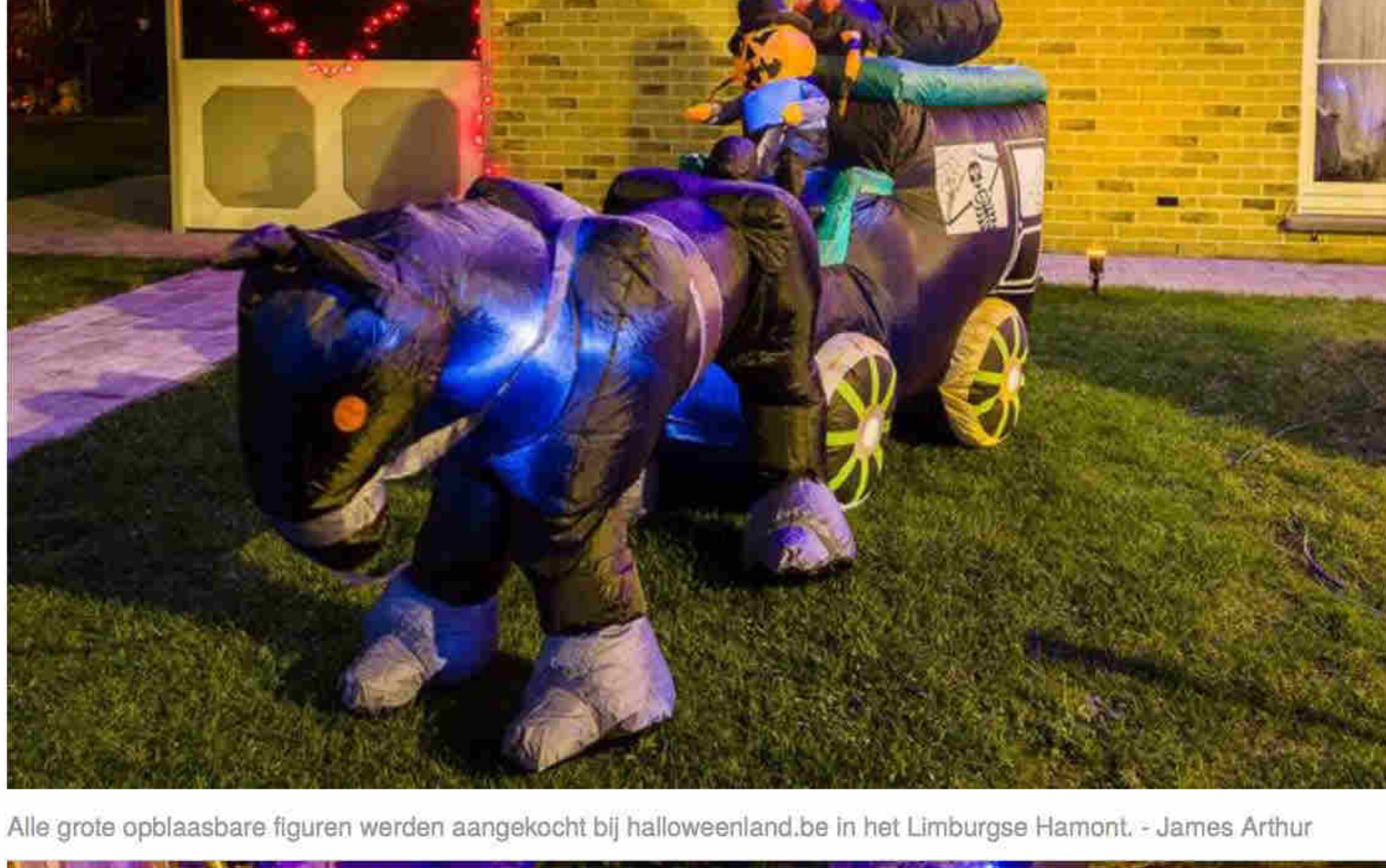
Alle grote opblaasbare figuren werden aangekocht bij halloweenland.be in het Limburgse Hamont. - James Arthur