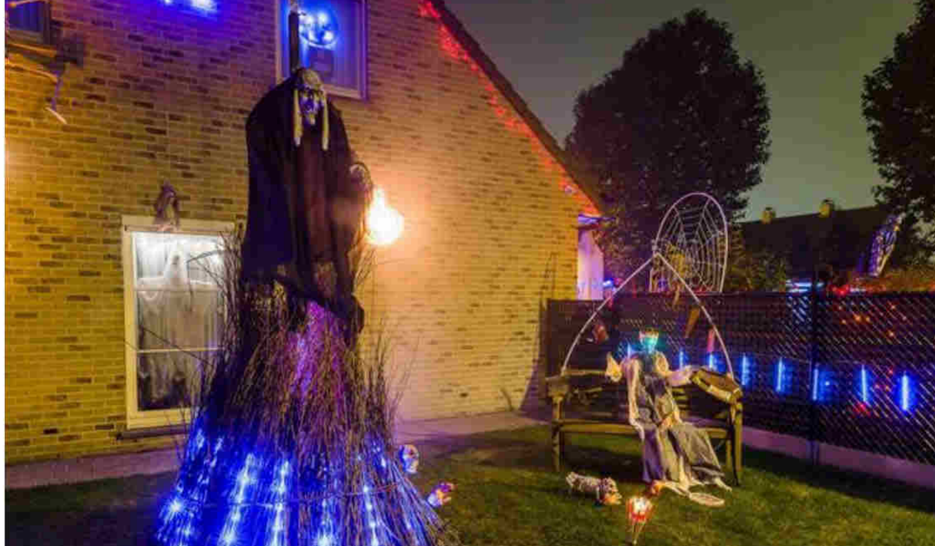
Deze brandstapel met heks is zelf gemaakt. - James Arthur