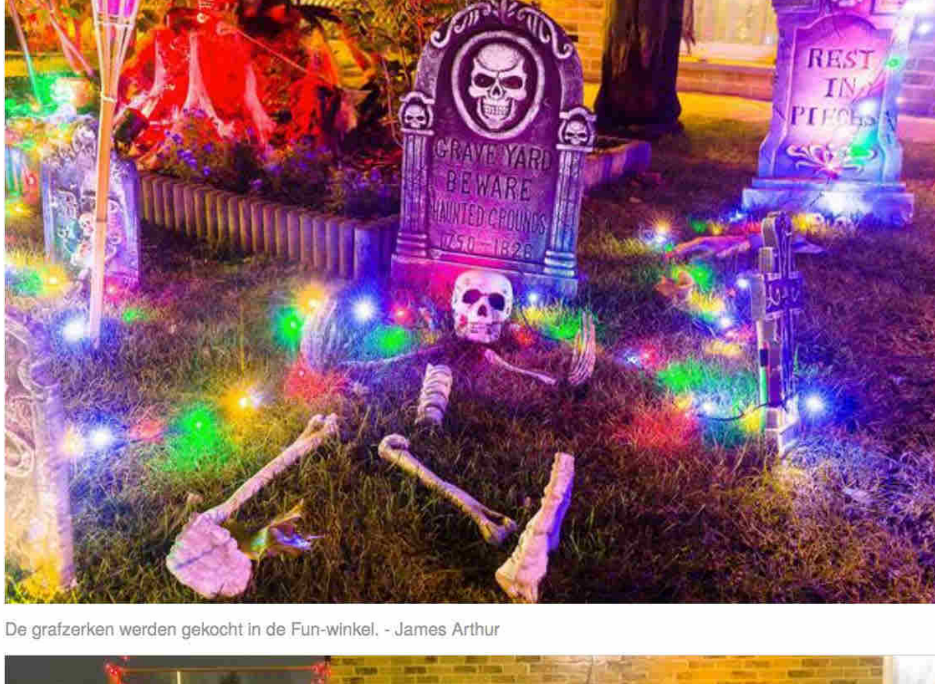
De grafzerken werden gekocht in de Fun-winkel.